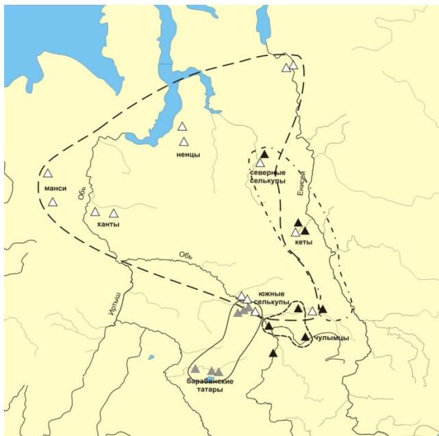
Рис. 2. Генетические связи южных селькупов

Другие генетические линии (N1b-E, Q1a2, R1b-M73) в составе южных селькупов являются минорными. Но, тем не менее, каждая из этих линий отражает процесс вхождения новых компонентов в состав предков селькупов. Часть из них (группа R1b-M73), видимо, отражает вхождение в состав предков селькупов тюркских групп южного происхождения из Томского Приобья. Другие линии (N1b-E и Q1a2), в связи с тем, что близкие гаплотипы встречаются у хантов, показывают вхождение в состав селькупов угорских групп (рис. 2).