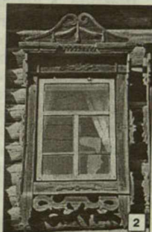
Оконные наличники: 1 — в с. Кожевниково, 2 — в с. Вороново. 19 апреля 2002 г.

В 1703 г. в этой же деревне было отмечено уже второе колено первооснователей: дети Степана Фомина Кожевникова (Афанасий, Микита, Семён), дети Петра Борисова Большого Кожевникова, сын боярский Андрей Соболевский и казачий сын Лука Стрелковский. Отец Петра Борисова — Борис Кожевников — упоминается в 1670 г. как конный казак; вероятно, он был сыном Ивана Иванова Кожевникова. Даже если отцом был не Иван, то всё равно кто-то из его братьев-первопроходцев, поскольку сам Пётр Борисов Кожевников утверждал: его дедом, то есть отцом Бориса, был один из братьев Кожевниковых, ставивших Томский город.