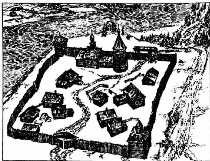
Вид Уртамского острога. Реконструкция И.Д. Резуна. Худ. А.А. Заплавный. Из кн.: Резун Д.Я., Васильевский Р.С. Летопись сибирских городов. Новосибирск, 1989. С. 279

В Тобольске Юрий Соболевский служил либо в казаках, либо в детях боярских до 1667 г., когда закончилась война и, согласно Анд-